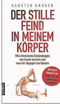
Wie chronische Entzündungen uns krank machen und was wir dagegen tun können

Viele Menschen erwerben eine stille Entzündung aufgrund von Bewegungsmangel in Kombination mit einer zuckerreichen Ernährung. Mit dem Bauchfett, dem so genannten viszeralen Fettgewebe vor dem Unter-